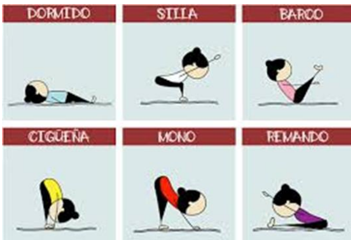
Ficha n° 3