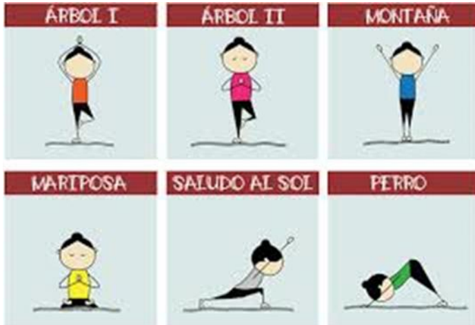
Ficha n° 1

1.- Debes elegir una de las tres fichas para desarrollar durante 7 días, se recomienda que pruebes cada posición al menos 4 veces para ir verificando que este correcta y equilibrada.