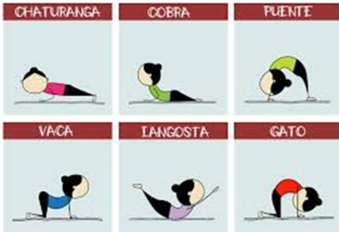
Ficha n° 2