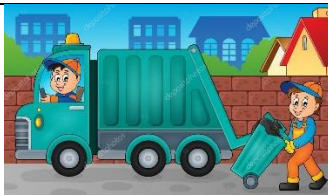
b) Recolector de basura.