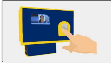
Control De Asistencia Biométrico- Huella Dactilar