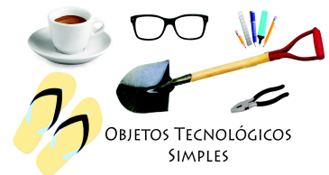
OBJETOS TECNOLÓGICOS SIMPLES

Objeto tecnológico simple , Se componen de pocas partes, no contienen mecanismos mecánicos complejos, siendo su propia forma la que facilita la función . Hacen uso de sólo energía manual (energía que es ejercida y producida por la fuerza que ejerce nuestro cuerpo ya sean manos o pies).