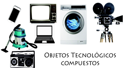
OBJETOS TECNOLÓGICOS COMPUESTOS

Objeto tecnológico compuesto , Cuentan con varias partes, y utilizan mecanismos y circuitos de mayor complejidad. Para funcionar en general requieren de combustibles (gas, bencina, diesel, etc) o energía eléctrica proveniente de distintas fuentes (conectados directamente con un enchufe, pilas o baterías).