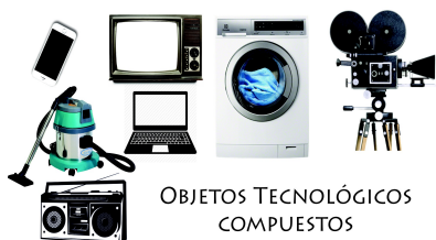
OBJETOS TECNOLÓGICOS COMPUSTOS

Objeto tecnológico compuesto , cuentan con varias partes, y utilizan mecanismos y circuitos de mayor complejidad. Para funcionar en general requieren de combustibles (gas, bencina, diesel, etc), o energía eléctrica proveniente de distintas fuentes (conectados directamente con un enchufe, pilas o baterías).